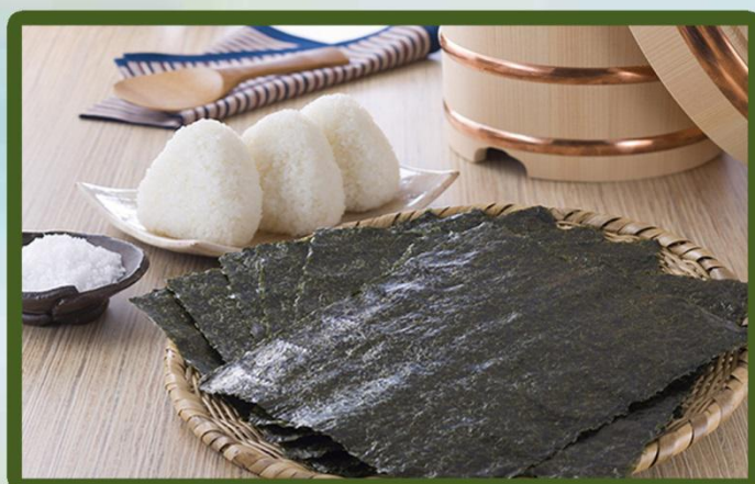
韩国特产海苔 Korean specialty seaweed