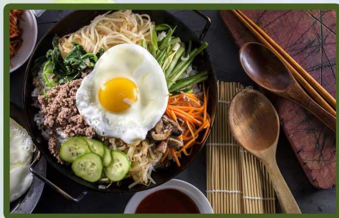
美味韩国拌饭 Delicious Korean Rice Dressed