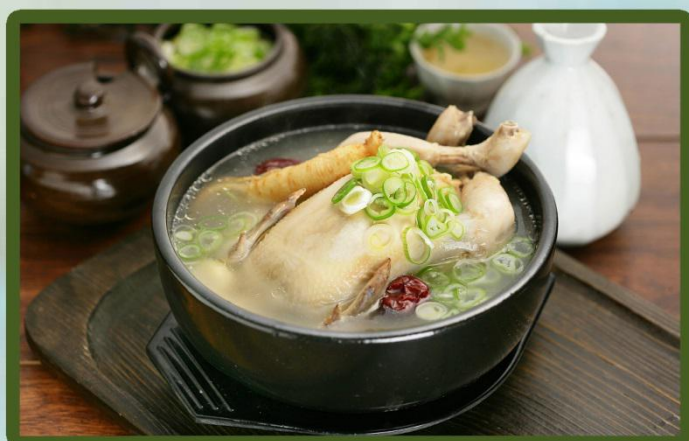
韩国人参鸡汤 Korean ginseng chicken soup