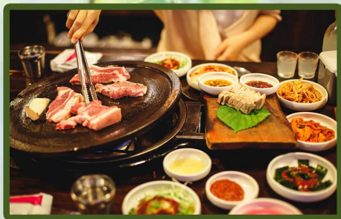
经典韩式烤肉 Classic Korean barbecue