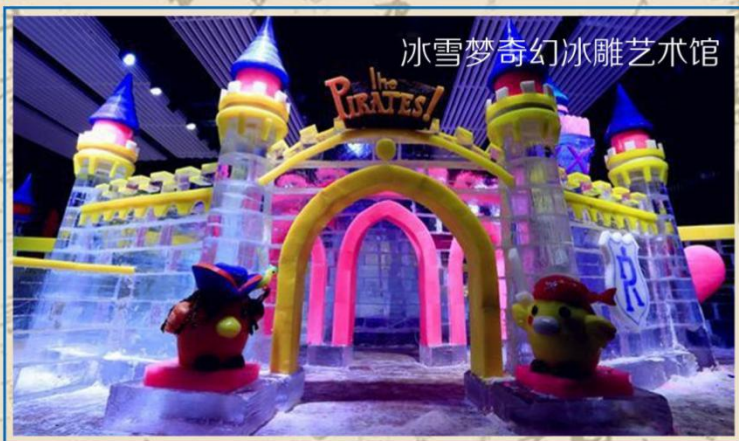
冰雪梦奇幻冰雕艺术馆