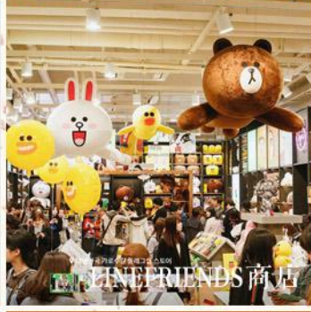
LINE FRIENDS 商店