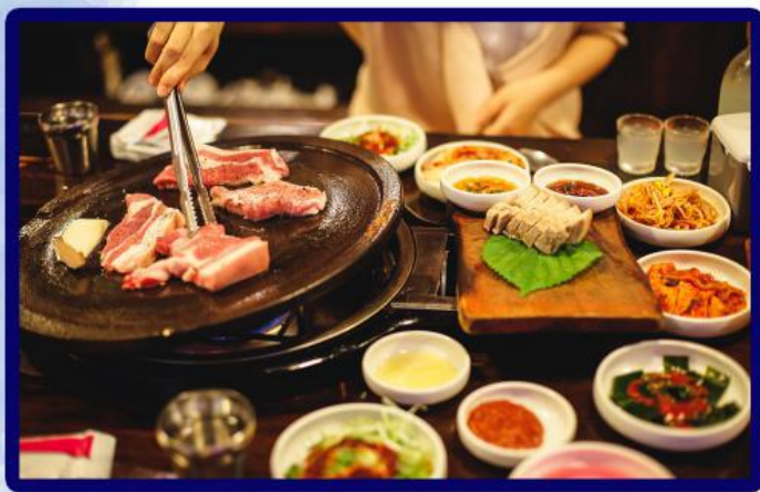
经典韩式烤肉 Classic Korean barbecue