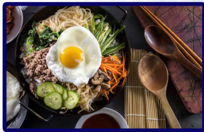
美味韩国拌饭 Delicious Korean Rice Dressed