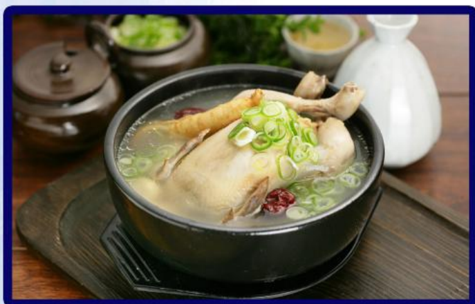
韩国人参鸡汤 Korean ginseng chicken soup