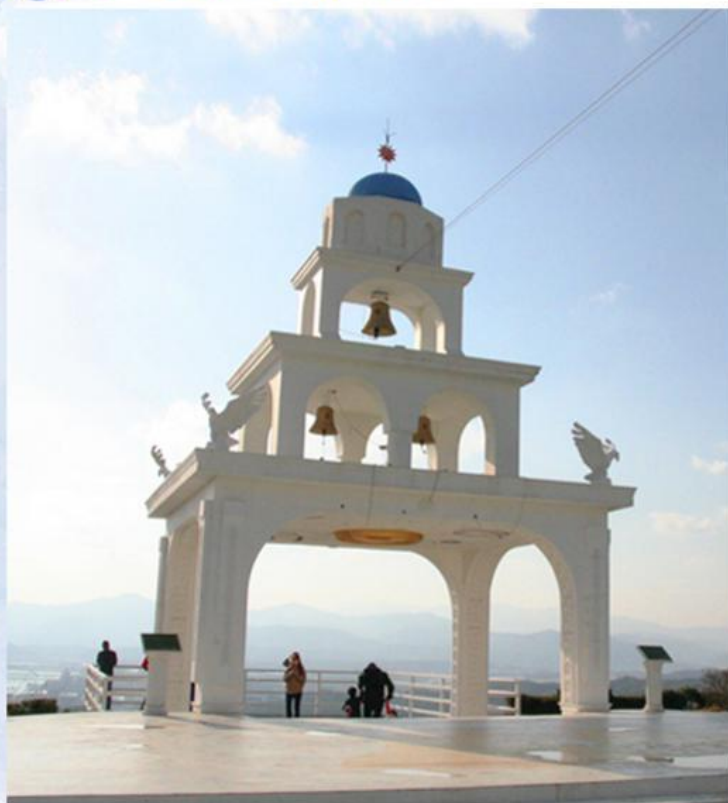
05 九峰山观景台咖啡街