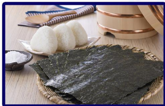
韩国特产海苔 Korean specialty seaweed