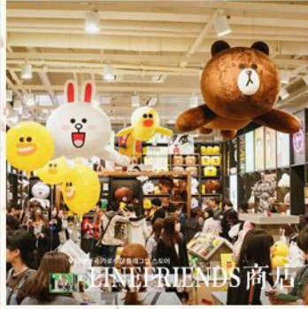
LINE FRIENDS 商店