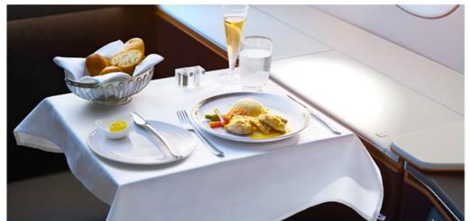
空中美食 | AIR FOOD