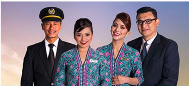
优质团队 | QUALITY TEAM