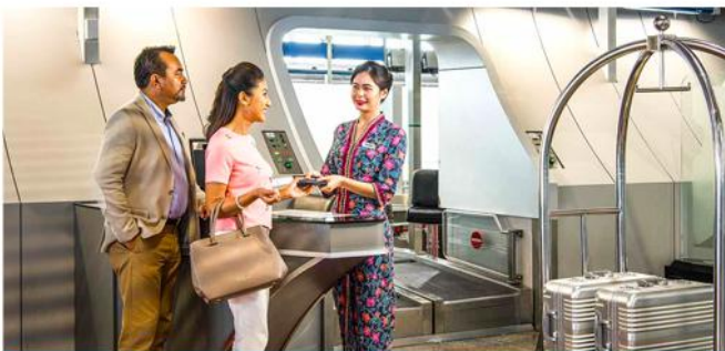
微笑接待 | SMILING RECEPTION