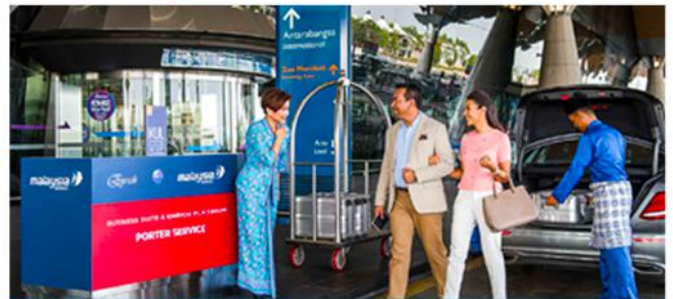
贴心服务 | CARING SERVICE