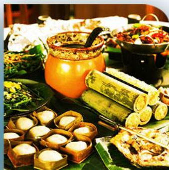
◎ 波隆人家田园风味