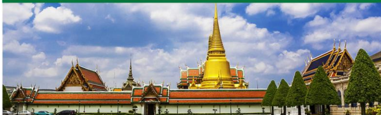
大皇宫 | 玉佛寺