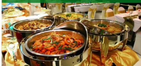
东方公主号游船餐