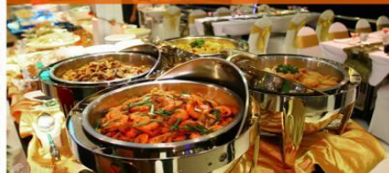
夜游湄南河自助餐