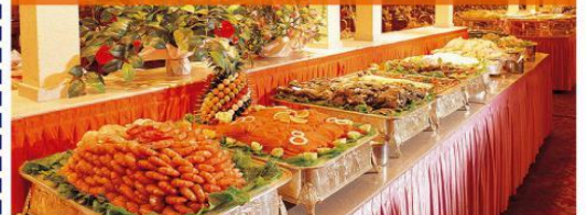
御府宫廷歌舞自助宴会