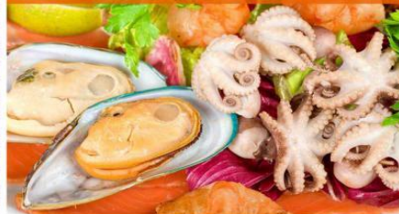
泰式海鲜风味味餐