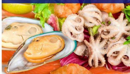
泰式海鲜风味味餐