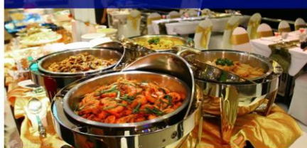
夜游湄南河自助餐