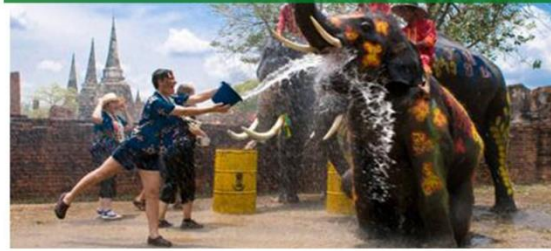
宋干文化旅游景区