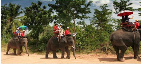
沙发里骑大象四合一