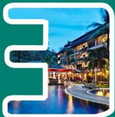
晚私人沙滩泳池别墅