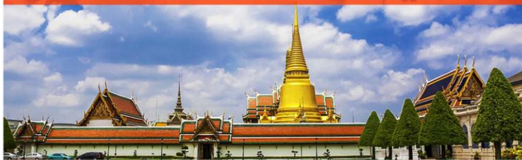
大皇宫 | 玉佛寺 | 皇家宝藏宫