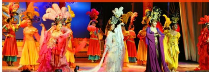
金东尼人妖歌舞表演