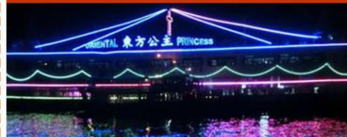
东方公主号游船晚餐