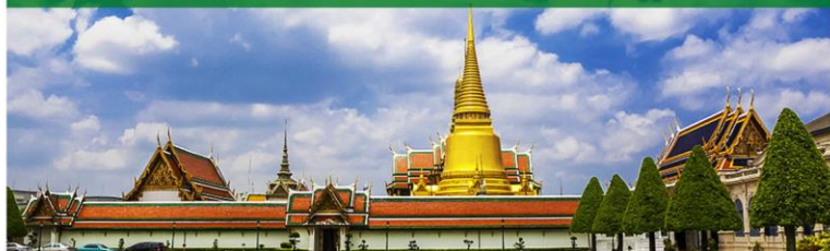
大皇宫 | 玉佛寺 | 皇家宝藏宫