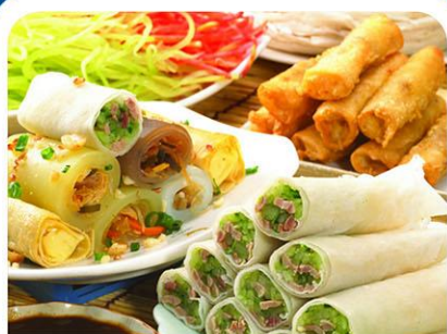
—— 越南春卷 ——