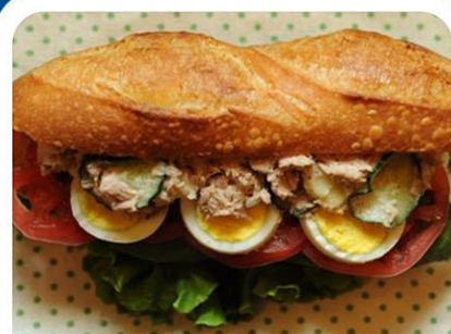
—— 越南法棍 ——