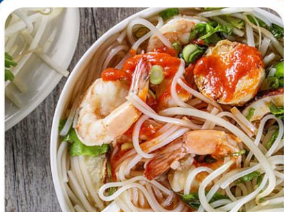
—— 越南米粉 ——