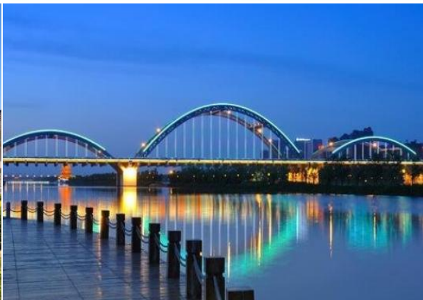
山西博物院、汾河景区