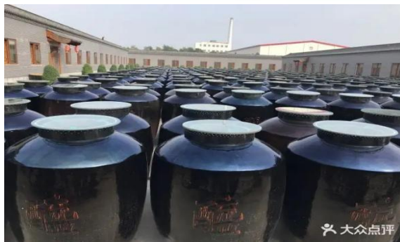
明清一条街、宝源老醋坊