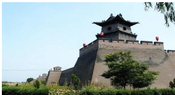
乔家大院、平遥古城