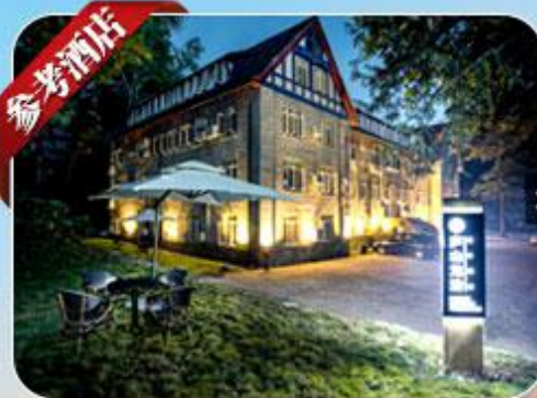
品啡酒店 婺源梦里老家店 Wuyuan Zhefei Resort Hotel