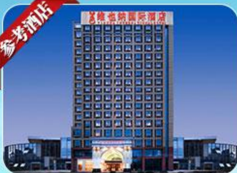
维也纳国际酒店 Vienna International Hotel