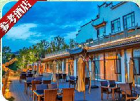
品啡酒店 婺源梦里老家店 Wuyuan Zhefei Resort Hotel