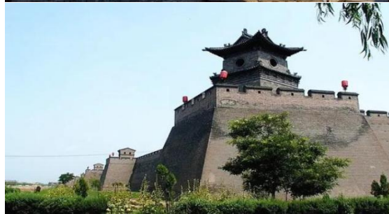
乔家大院、平遥古城