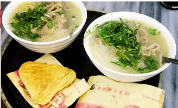
滨河味道(南内环店)、郝刚刚羊杂割