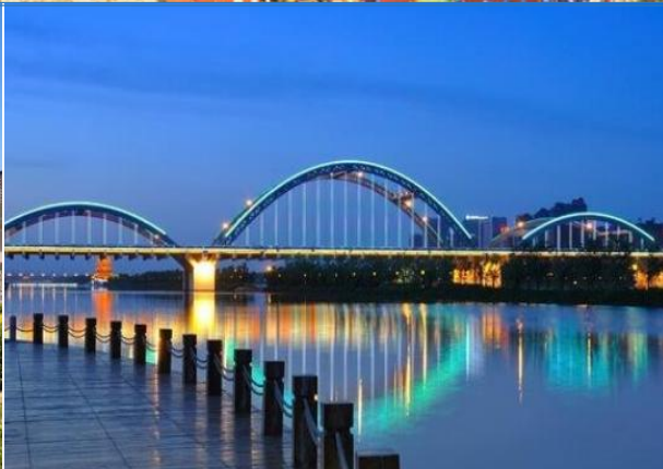
山西博物院、汾河景区