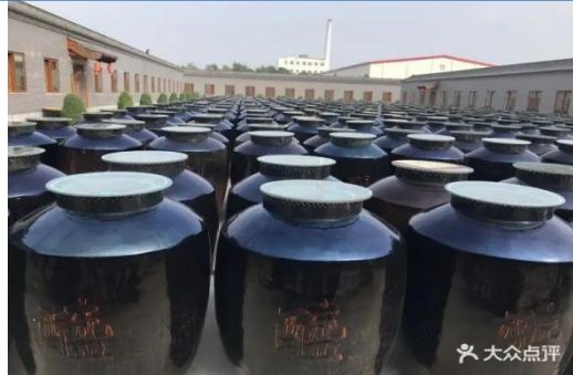
明清一条街、宝源老醋坊