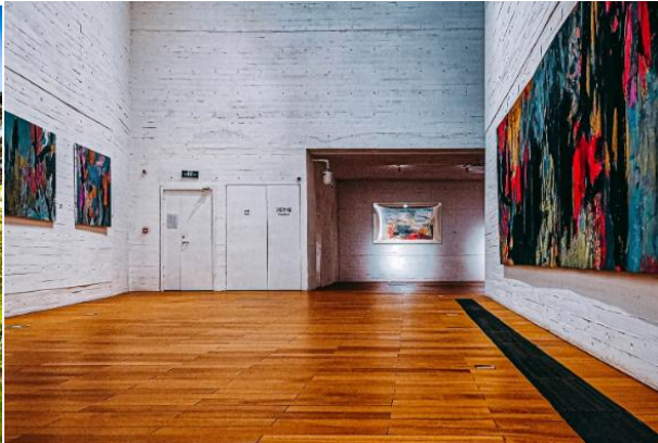
迎泽公园、长江美术馆