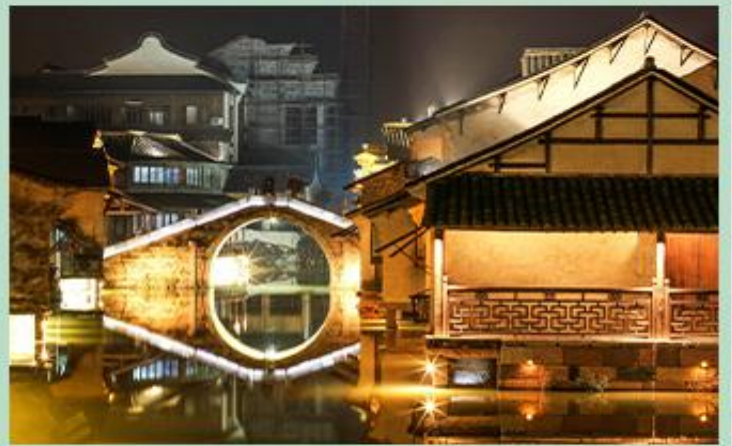
乌镇西栅 安然隐居在诗与画的意境里，尽享片刻的恬静与优雅