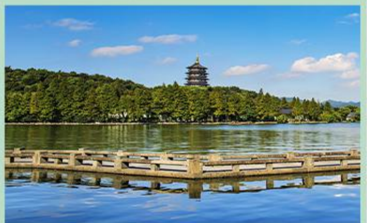
西湖 景区是一处以秀丽清雅的湖光山色与璀璨丰蕴的文物古迹和文化艺术交融一体的国家级风景名胜