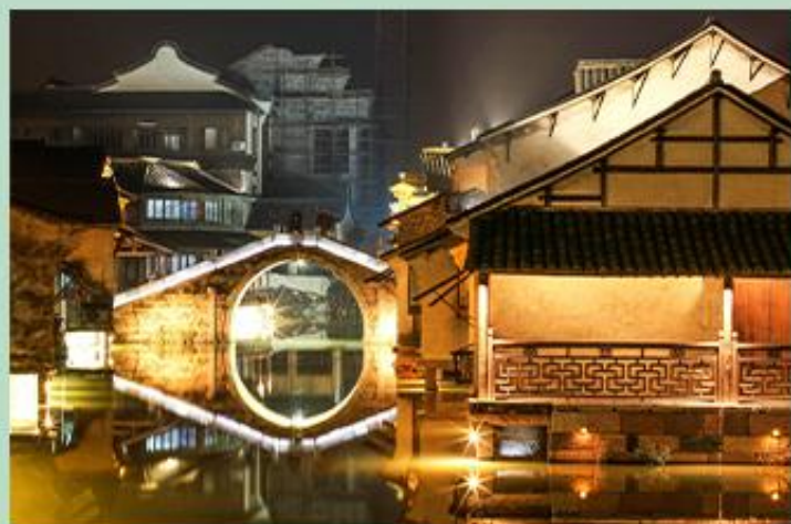
乌镇西栅 安然隐居在诗与画的意境里，尽享片刻的恬静与优雅