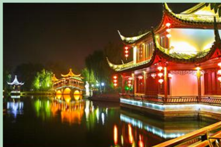
西塘 夜幕之下，沿着烟雨长廊，漫步在西塘夜色之中