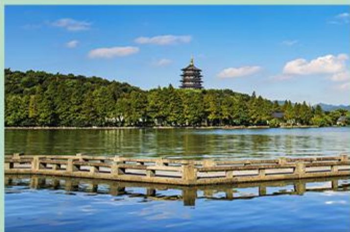
西湖 景区是一处以秀丽清雅的湖光山色与璀璨丰蕴的文物古迹和文化艺术交融一体的国家级风景名胜