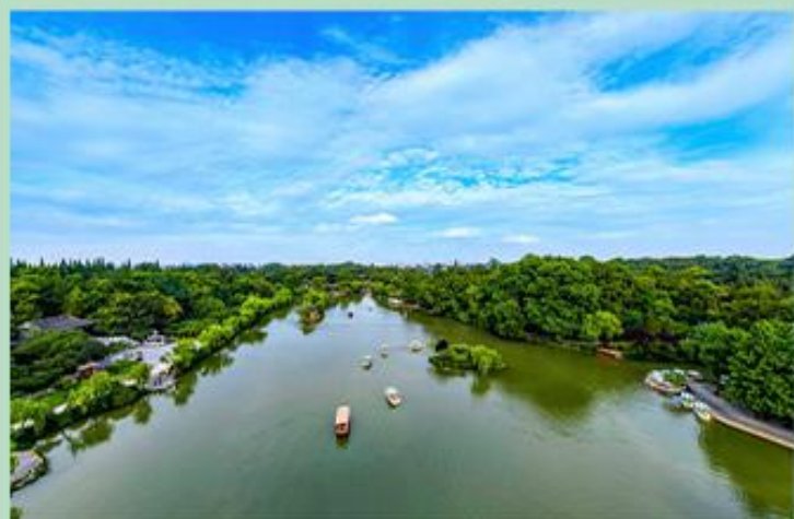
西湖 景区是一处以秀丽清雅的湖光山色与璀璨丰蕴的文物古迹和文化艺术交融一体的国家级风景名胜区