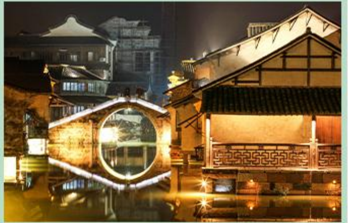
乌镇西栅 安然隐居在诗与画的意境里，尽享片刻的恬静与优雅