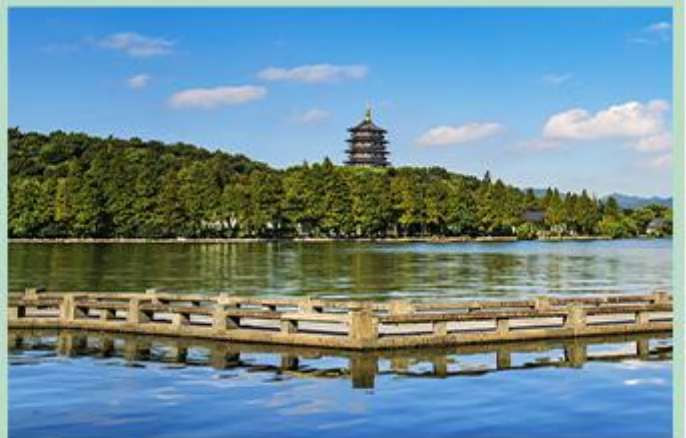
西湖 景区是一处以秀丽清雅的湖光山色与璀璨丰蕴的文物古迹和文化艺术交融一体的国家级风景名胜