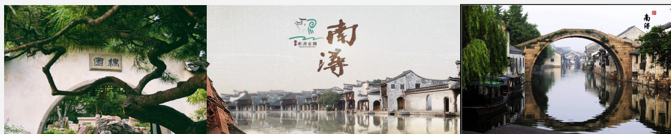
大宅园林交相辉映的街区特色。

江南水乡古镇诗画一般的神韵。南浔古镇素有“文化之邦”和“诗书之乡”之称，沿着悠悠的江南水巷，体验“南浔古镇大型水乡婚礼秀”，为相濡以沫的她补办一场温馨浪漫的婚礼，重回激情燃烧的岁月。古镇以南市河、东市河、西市河、宝善河构成的十字河为骨架，其间又有许多河流纵横交错，街和民居沿河分布，随河而走，以南东街、南西街为串联，构成了十字型格局，街巷肌理完整，河道水系基本保存。十字河两岸形成商业街道，既有傍水筑宇、沿河成街的江南水乡小镇风貌，又有众多高品质的私家大宅第和江南园林，形成了小桥流水人家与