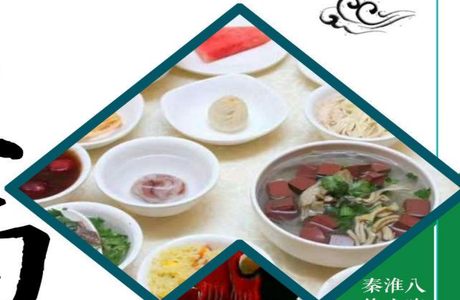
秦淮八绝小吃套餐