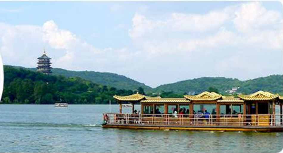
独家安排 · 船游西湖 · 品尝茶歇