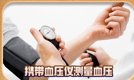
携带血压仪测量血压