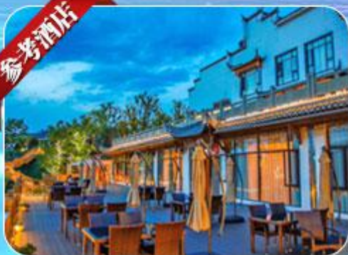
品啡酒店 婺源梦里老家店 Wuyuan Zhefei Resort Hotel