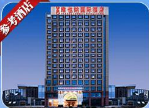
维也纳国际酒店 Vienna International Hotel