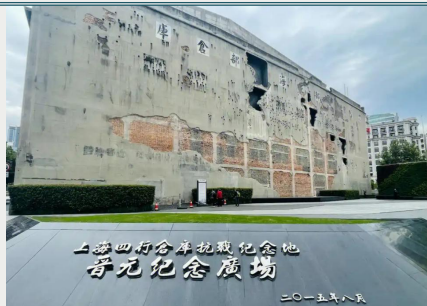
上海四行仓库抗战纪念馆 寻元纪念广场