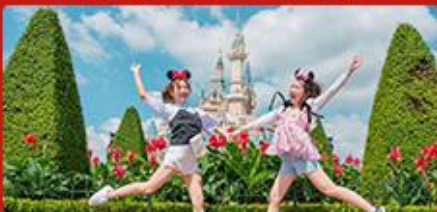
迪士尼乐园 全天畅游，体验神奇的一天