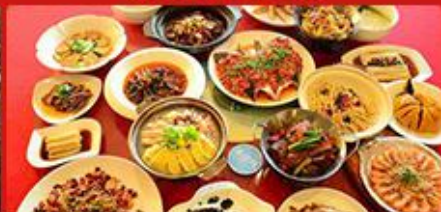
特色美食 江南特色美食体验