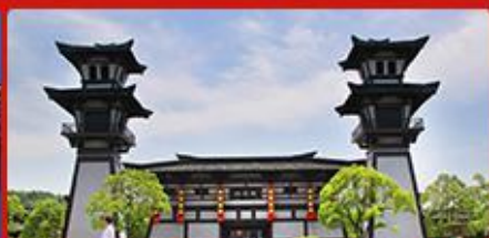
三国城、水浒城 历史影视城