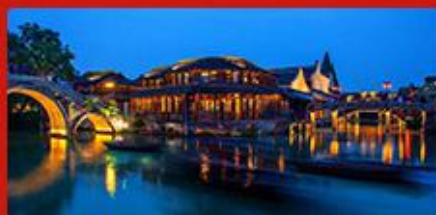
两大王牌水乡 乌镇、周庄