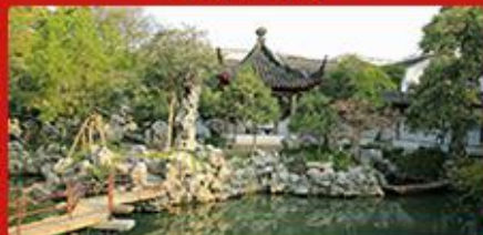
沧浪亭+可园 四大名园之一