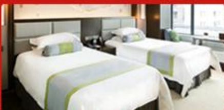
住宿升级 升级2晚五星酒店