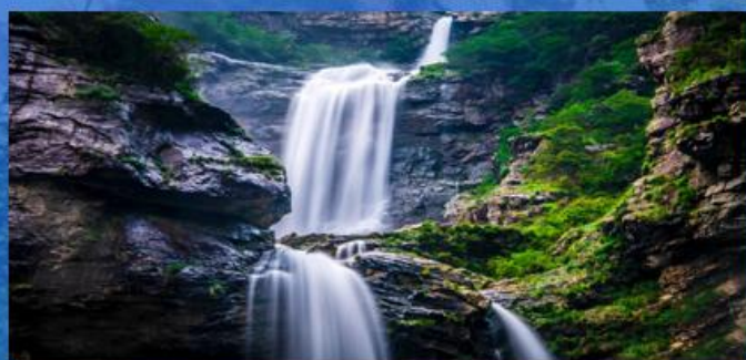
▶ 三叠泉 不到三叠泉，不算庐山客