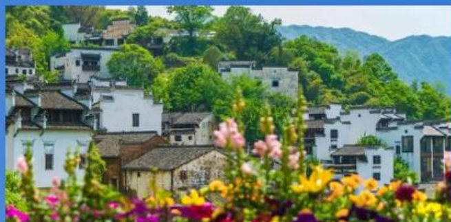
▶ 篁岭 花溪水街 天街小镇