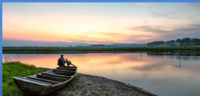
▶ 鄱阳湖 中国最大淡水湖