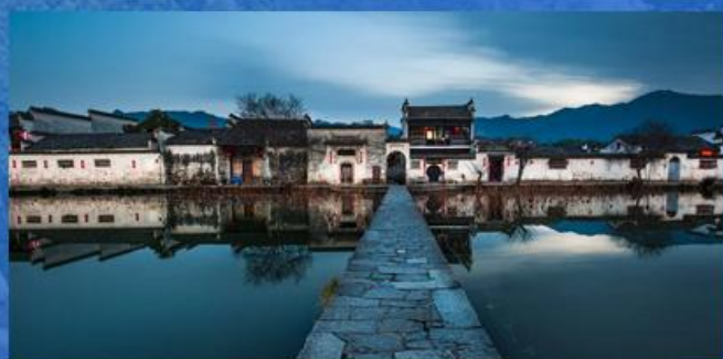
▶ 宏村 画里乡村