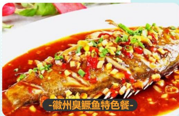
-徽州臭鳜鱼特色餐-