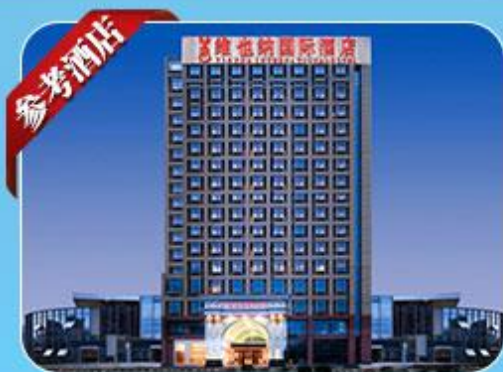
维也纳国际酒店 Vienna International Hotel