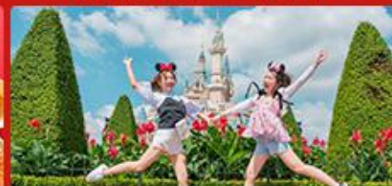
迪士尼乐园 全天畅游，体验神奇的一天