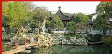
沧浪亭+可园 四大名园之一