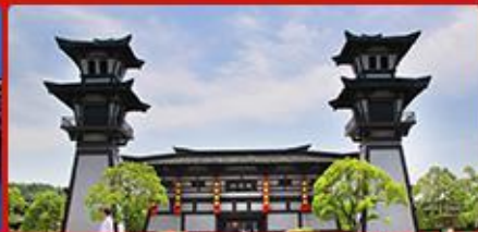
三国城、水浒城 历史影视城