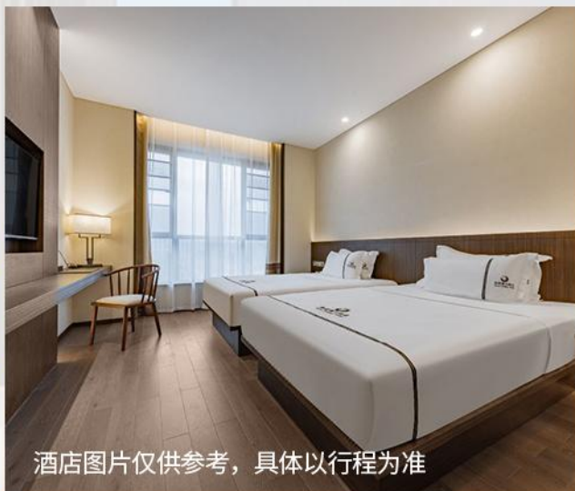
酒店图片仅供参考，具体以行程为准