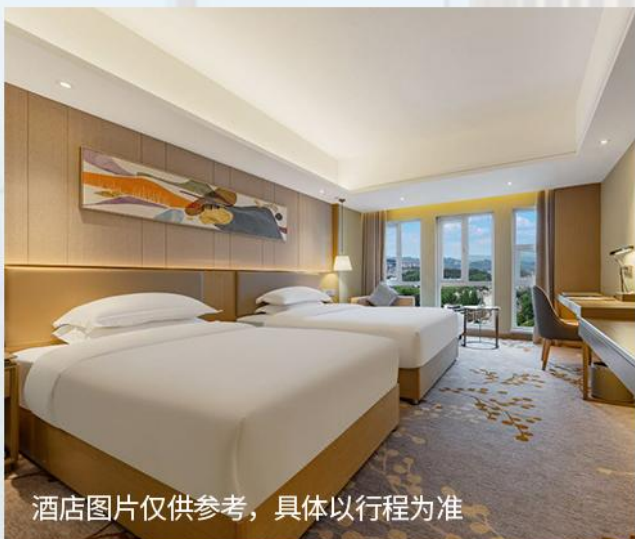
酒店图片仅供参考，具体以行程为准