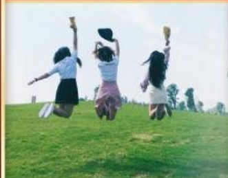
全程无忧旅程，臻享纯玩 无购物，体验更在途中