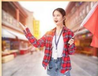
优秀导游讲述千年古都 带您饱览长安美景