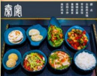
秦始皇统一天下后招待六国使臣的【秦宴】