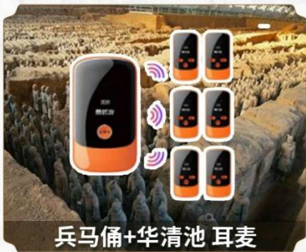
兵马俑+华清池 耳麦