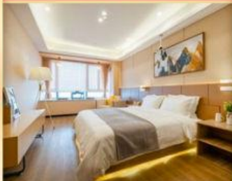
精选标准酒店 让你全程舒适睡眠