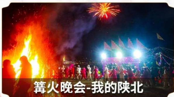
篝火晚会-我的陕北