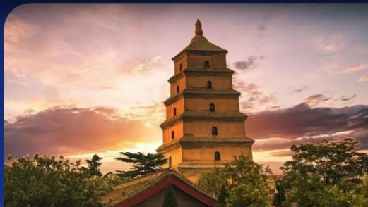
大慈恩寺 Da Ci'en Temple