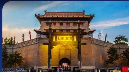
南门城墙 South Gate City Wall