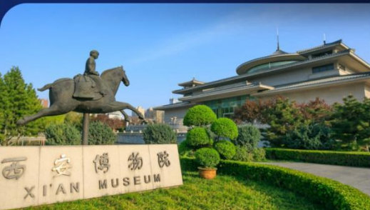
西安博物院 Xi'an Museum