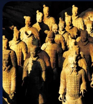
兵马俑 Terra Cotta Warriors