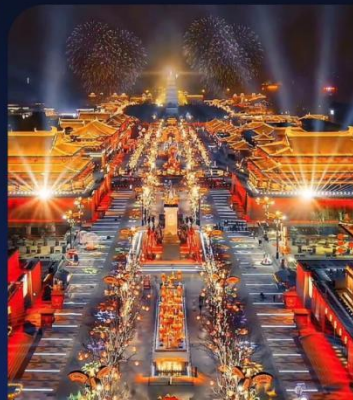
大唐不夜城 Tang Dynasty Never Nights City