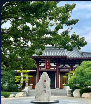
华清宫 Huaqing palace