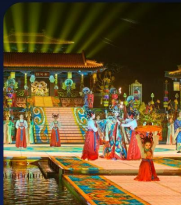
长恨歌 Changhen Song

长恨歌/兵马俑/华清宫/大唐不夜城/南门城墙/西安博物院/大慈恩寺 书院门/安仁坊/易俗社/钟鼓楼广场/回民街