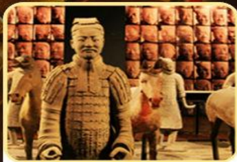
兵马俑/华清宫/西安博物院 明城墙（上城墙）