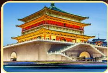
大明宫遗址公园 钟鼓楼广场/回民街