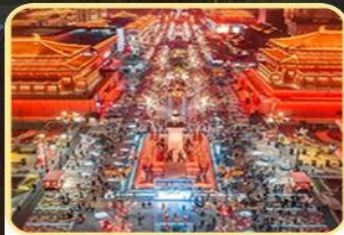
大雁塔北广场 大唐不夜城