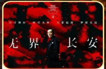
赠送价值288元/人 【无界长安】

无界长安/白鹿原/兵马俑/华清宫/西安博物院/明城墙/钟鼓楼广场 回民街/大明宫遗址（免费区）/大唐不夜城