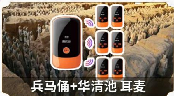
兵马俑+华清池 耳麦