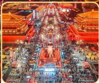
大雁塔北广场 大唐不夜城