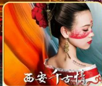
西安千古情 赠送价值298元/人 《西安千古情》

西安千古情/白鹿原/兵马俑/华清宫/西安博物院/明城墙/钟鼓楼广场 回民街/大明宫遗址（免费区）/大唐不夜城