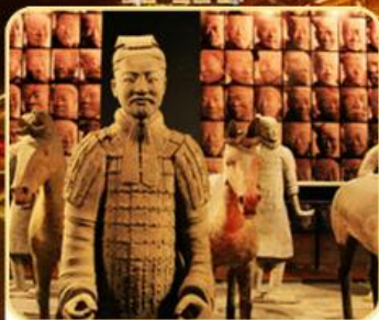
兵马俑/华清宫/西安博物院 明城墙（上城墙）