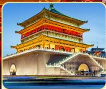
大明宫遗址公园 钟鼓楼广场/回民街