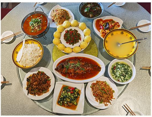
记忆里的红色味道—《红军宴》