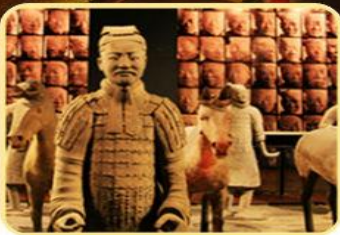
兵马俑/华清宫/西安博物院 明城墙（上城墙）