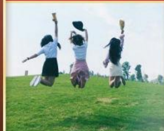
全程无忧旅程, 臻享纯玩 无购物, 体验更在途中