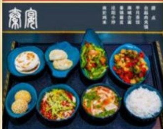
秦始皇统一天下后招待六国使臣的【秦宴】