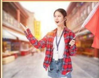
优秀导游讲述千年古都 带您饱览长安美景