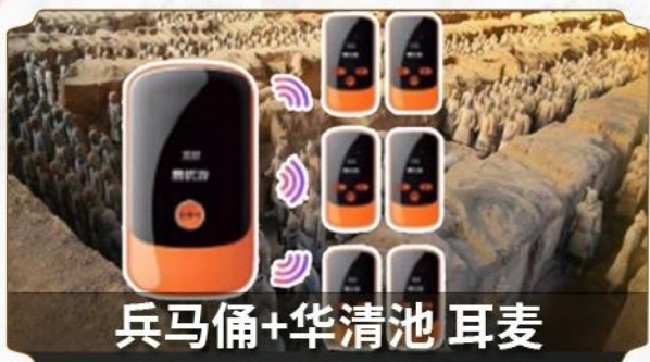
兵马俑+华清池 耳麦