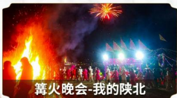
篝火晚会-我的陕北