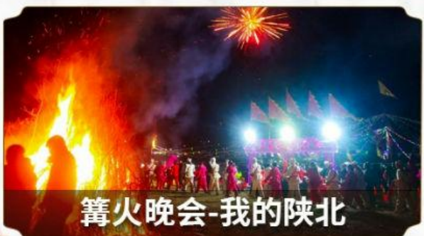
篝火晚会-我的陕北