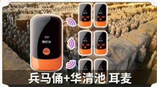
兵马俑+华清池 耳麦