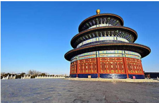
天坛公园 北京的主要标志建筑