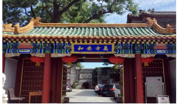
特别安排体验入住故宫周边主题四合院酒店2晚（河北迎、唐府、竹园、）