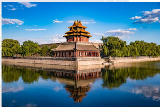
故宫博物院 明清遗留下来的皇家宫殿和旧藏珍宝