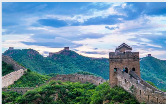
八达岭长城 全国十大风景名胜之首