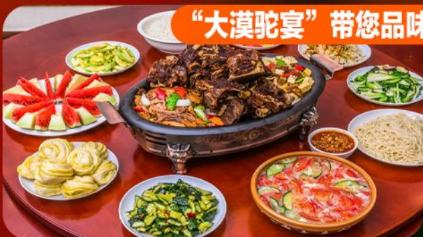
“大漠驼宴”带您品味茅台镇酱香型定制白酒!